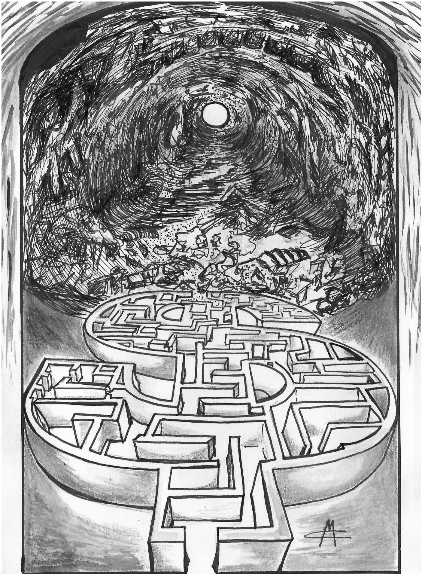
Advent podle Moniky Chocové